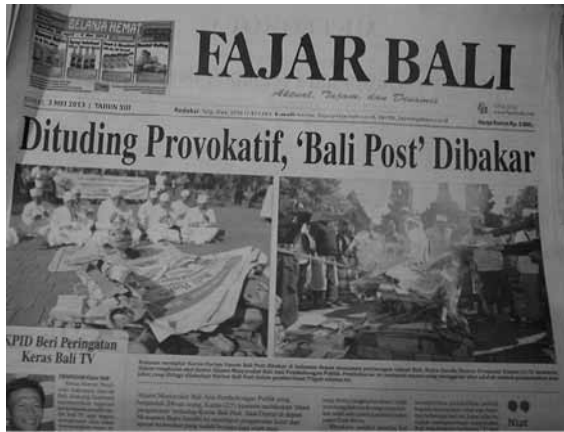
Berita Pengabenan Koran Bali Post di Bajar Sandhi

Koran BP dituding melakukan provokasi aktif baik melalui pemberitaan dan iklan banner yang seolah-olah ingin mengajak masyarakat Bali mengganti Gubernur dan memilih Gubernur yang dilegitimasi BP melalui wacana Ajeg Balinya. Selain itu, Koran BP juga melakukan pembohongan publik dengan terus menjelekkkan salah satu kandidat. Sementara istilah pengabenan yang digunakan oleh aliansi ini hanya sebagai simbol membunuh niat jahat dan tingkah laku BP yang menggiring opini publik ke salah satu kandidat saja yakni A.A Ngurah Puspayoga.