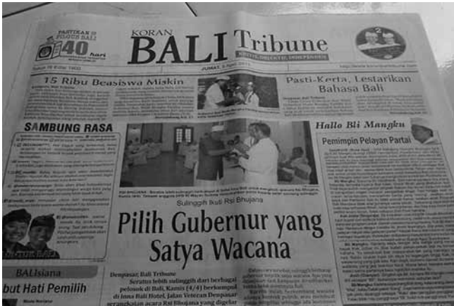
Berita Tentang acara Rsi Bhujana

untuk masuk dalam kontrak politik terdiri dari beberapa poin. Pertama, pentingnya melestarikan bahasa Bali melalui regulasi yang memasukkannya dalam mata pelajaran di sekolah, memperjuangkan otonomis khusus untuk Bali, melindungi dan mengamankan tanah-tanah laba pura serta tanah adat dari pengambilalihan investor nakal, melindungi dan mempertahankan bhisama kesucian pura PHDI yang tertuang dalam Perda Tata Ruang Bali, mencegah dan memberantas korupsi, melakukan pemerataan pembangunan di Bali, dan pentingnya gubernur serta kepala daerah melibatkan sulinggih semua unsur sebagai bagawanta dalam pengambilan keputusan.