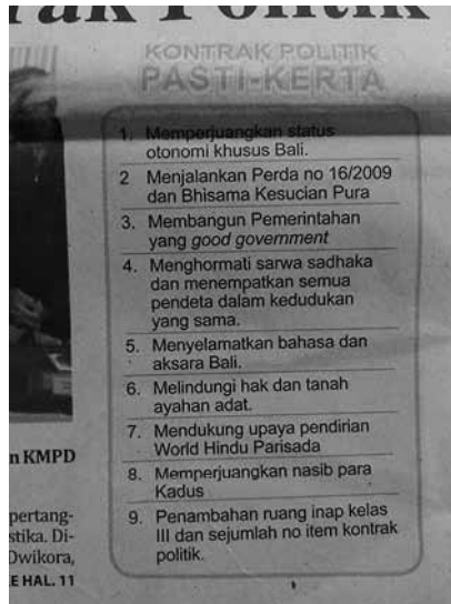
Poin Kontrak Politik yang dimuat Fajar Bali

Sebagaimana diketahui, isu tentang kedudukan sulinggih dalam muput upacara agama merupakan isu historis dari konflik kasta di Bali. Pada tahun 1980-an, perdebatan soal kedudukan sulinggih dalam memimpin upacara agama dalam karya agung Eka Dasa Rudra , yaitu upacara bhuta yadnya seratus tahun sekali yang dilaksanakan di Besakih juga muncul. Pada saat itu, upacara bhuta yadnya dipuput oleh Pedanda Siwa, Budha dan Rsi Bhujangga (Triguna, 1997:245). Ketiga pendeta ini disebut sebagai Tri Sadaka . Istilah ini muncul atas jasa Mpu Kuturan ketika berusaha menyatukan Sembilan sekte menjadi Budha, Siwa dan Waisnawa di Bali (Eiseman, 1994:70).