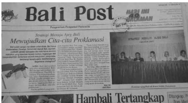
Gambar 5.1 Seminar Ajeng Bali Bali Post Tahun 2003

Sebagaimana diketahui, wacana Ajeng Bali diluncurkan saat pembukaan Bali TV pada bulan Mei 2002, ketika Gubernur Bali I Dewa Made Beratha mendesak para pendengarnya agar mengajegkan adat dan kebudayaan Bali. Wacana Ajeng Bali ini muncul setelah Bali mengalami berbagai persoalan pembangunan sebagai risiko dibukanya industri turisme. Respon terhadap persoalan pembangunan dan munculnya wacana Ajeng Bali ini turut mengundang perhatian sejumlah kelas menengah terdidik Bali yang difasilitasi oleh media Bali Post untuk merumuskan kembali kebudayaan Bali yang paralel dengan wacana Ajeng Bali .