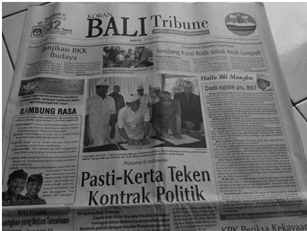
Mangku Pastika-Sudikerta Meneken Kontrak Politik

Acara penandatanganan kontrak politik ini dimuat menjadi berita headline news di dua media massa cetak yakni Bali Tribune dan Fajar Bali . Pada terbitan 13 April 2013 headline news harian Fajar Bali adalah “Pasti-Kerta Teken Kontrak Politik”, begitu juga Bali Tribune memuat berita dengan judul yang sama. Dalam tubuh berita, baik Fajar Bali maupun Bali Tribune memuat pernyataan Mangku Pastika yang siap menandatangani dan melaksanakan isi kontrak politik ketika dirinya terpilih menjadi Gubernur Bali periode 2013-2018. Menurut Mangku Pastika, kontrak politik yang ditawarkan tersebut merupakan kontrak sekala-niskala . Berikut pernyataannya: