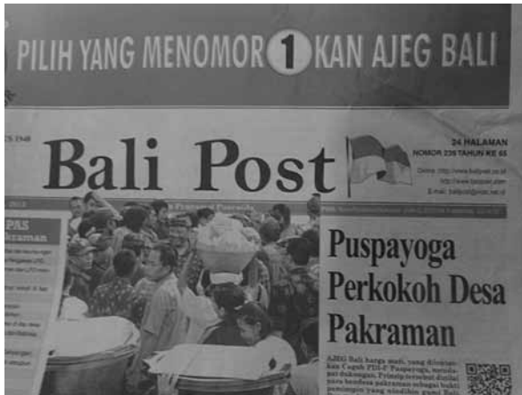
Halaman Depan Bali Post Soal Perkokoh Desa Pakraman

Sejak awal BP membangun konstruksi isu tentang sikap tidak Ajeng Bali -nya Made Mangku Pastika yang masih menjabat sebagai Gubernur Bali kala itu. Ini bisa dilihat ketika BP terus mempublikasi Mangku Pastika dengan pemberitaan yang menyangkut wacana kebudayaan. Seperti wacana Pembubaran Desa Pakraman setelah terjadinya konflik masyarakat Budaga-Kemoning pada tanggal 17 September 2011 di Kabupaten Klungkung.