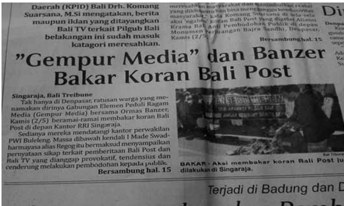
Berita Pembakaran Bali Post di Buleleng

Tidak hanya di Denpasar, aksi serupa juga muncul di Kabupaten Buleleng. Ratusan warga yang menamakan dirinya Gabungan Elemen Peduli Ragam Media ( Gempur Media ) bersama ormas Banzer Buleleng ramai-ramai membakar Koran BP di depan kantor RRI Singaraja. Aksi pembakaran ini merupakan pernyataan sikap kelompok masyarakat tersebut terhadap BP yang menyajikan berita-berita provokatif terhadap salah satu kandidat dengan iklan Ganti Gubernur dan stigma Ajeg Bali yang hanya dilekatkan pada Puspayoga. Sama seperti aspirasi Aliansi Masyarakat Anti Pembohongan Publik, kelompok massa ini juga menuding BP melakukan pembohongan publik yang sangat massif dan terencana.