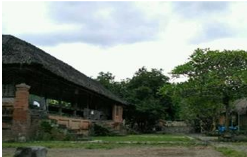
Gambar 2 Areal Pemukiman di Desa Adat Tenganan

daya air dan tata pengelolaan perlindungan hutan (Senasri, 2008). Sistem penataan desa berlandaskan pada konsep dualistis ( Rwa Bhineda ), yaitu konsepsi adanya dua hal yang berlawanan Pola pemukiman mengelompok ditengah-tengah desa yang dikeleilingi oleh bukit kangin, kauh dan kaja sedangkan di selatan merupakan pintu keluar Desa Adat Tenganan Pegringsingan menuju desa tetangganya Sedahan. Secara umum, struktur desa tersusun atas 4 (empat) arah mata angin yang sekaligus merupakan pintu (lawangan) dengan pusat terletak pada tegah- tengahnya, dengan fungsinya masing-masing (Gambar 2).