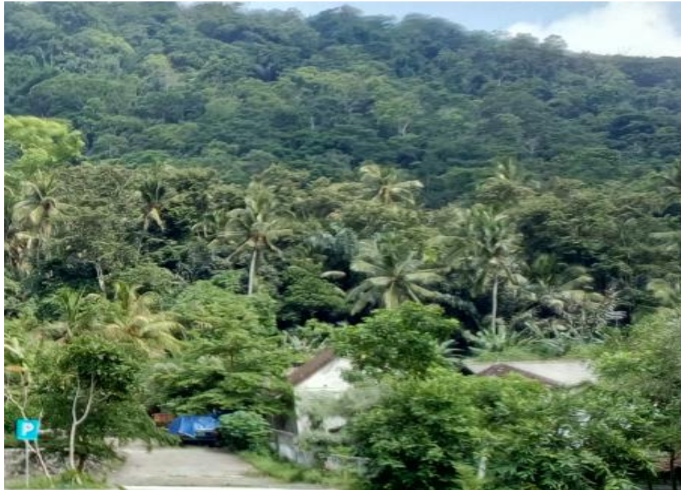
Gambar 1 Hutan Tenganan Pegringsingan

Upaya memelihara lingkungan hidup di Desa Adat Tenganan Pegringsingan termuat dalam awig-awig pasal 10 dan pasal 37. Dalam pasal 10 disebutkan bahwa orang luar desa dilarang memungut reruntuhan buah-buahan apapun yang dihasilkan di kebon atau hutan Desa Adat Tenganan Pegringsingan. Pelanggarnya bisa dikenakan denda sebesar 100.