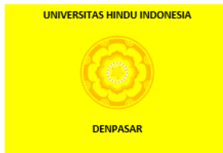
Gambar 2. 2. Bendera Universitas Hindu Indonesia

Bendera tiap Fakultas berbentuk segi empat panjang dengan perbandingan 3:2, dengan pola dasar yang sama dengan bendera universitas, dan tiap fakultas memiliki warna berbedabeda di sebelah kiri warna kuning emas, sesuai dengan warna keilmuan fakultas masing-masing. Pada setiap bendera Fakultas terdapat lambang UNHI yang diletakkan di tengah-tengah. Bendera UNHI dan bendera Fakultas dipergunakan secara hikmat pada upacara akademik atau upacara lainnya yang sesuai.