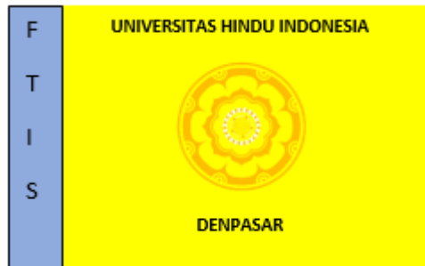
Gambar 2. 7. Fakultas Teknologi Informasi dan Sains (FTIS)