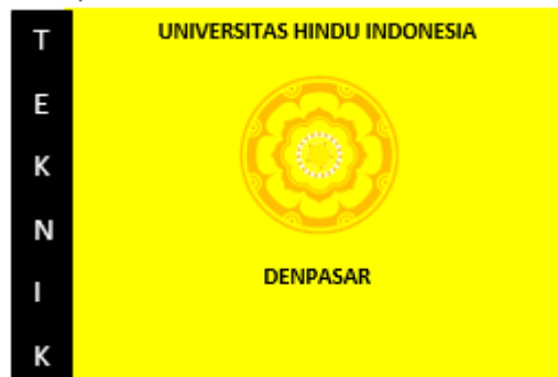
Gambar 2. 5. Bendera Fakultas Teknik