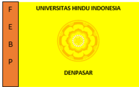
Gambar 2. 4. Bendera Fakultas Ekonomi Bisnis dan Pariwisata (FEBP)