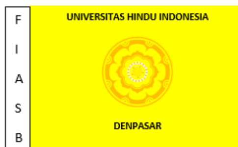
Gambar 2. 3. Bendera Fakultas Ilmu Agama Seni dan Budaya (FIASB)