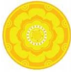
Gambar 2. 1. Lambang UNHI

Lambang Universitas Hindu Indonesia berbentuk Padma (teratai) yang tersusun atas: